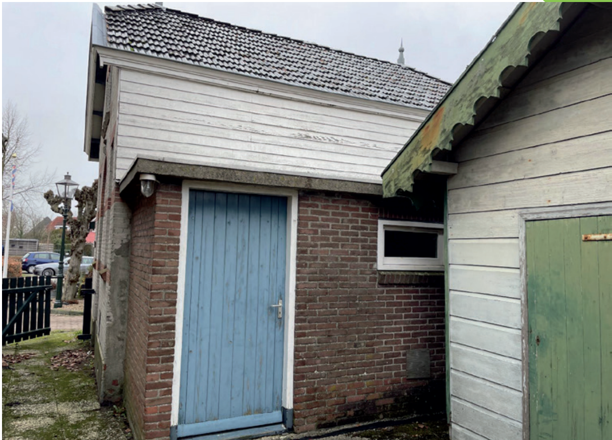
Achteraanzicht consistorie met ingang