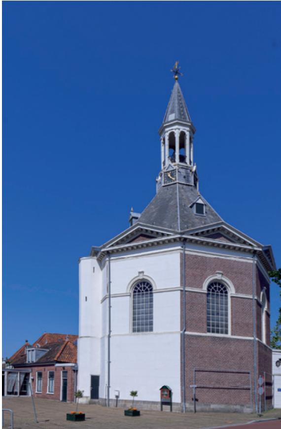
Kerkgebouw de Dorpskerk ('de Peperbus')