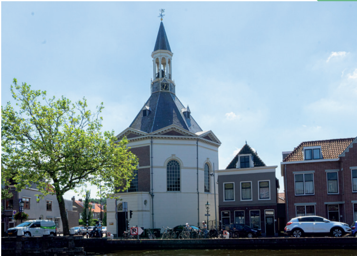
Kerkgebouw de Dorpskerk ('de Peperbus')