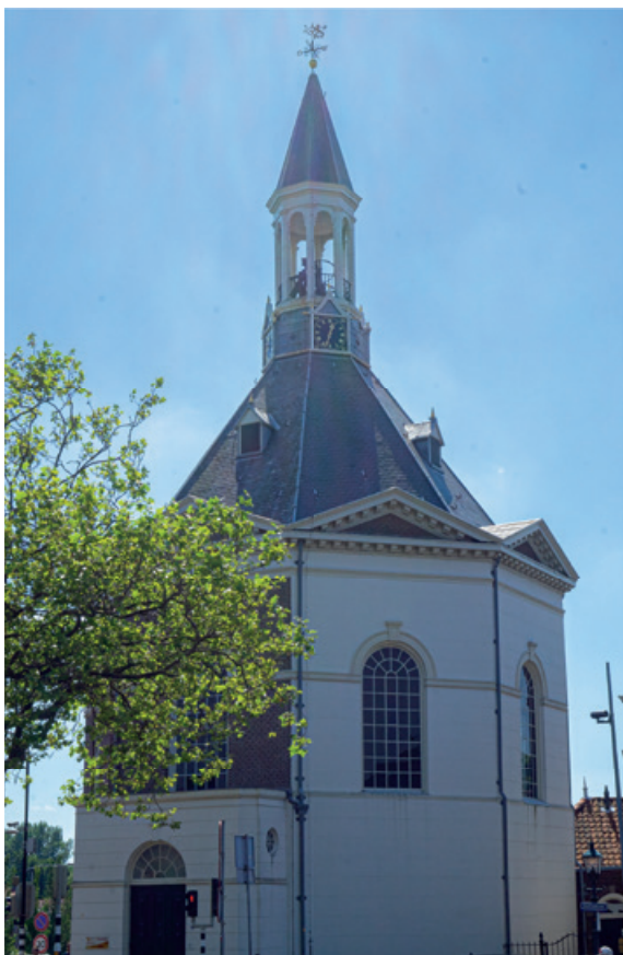
Kerkgebouw de Dorpskerk ('de Peperbus')