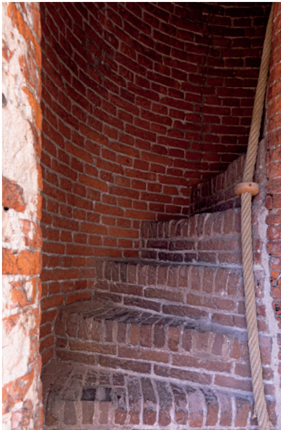
Trap naar zolder