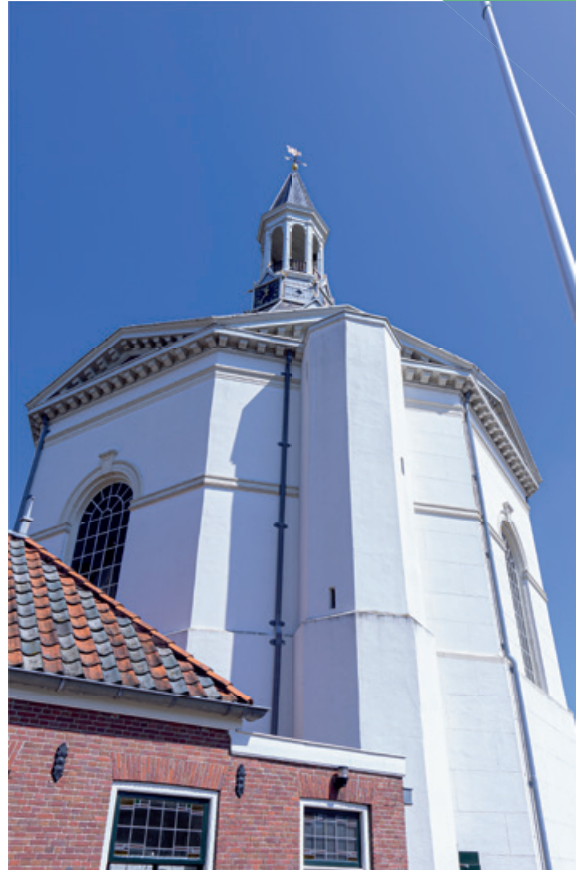
Kerkgebouw de Dorpskerk ('de Peperbus')