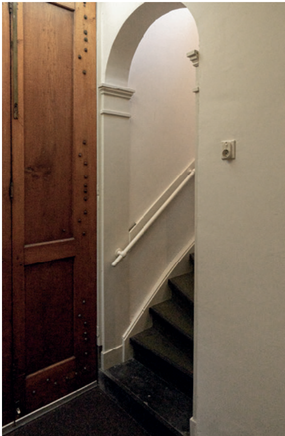
Trap naar verdieping