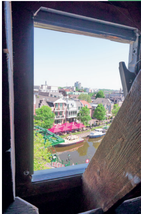
Uitzicht uit vlaggenluik toren