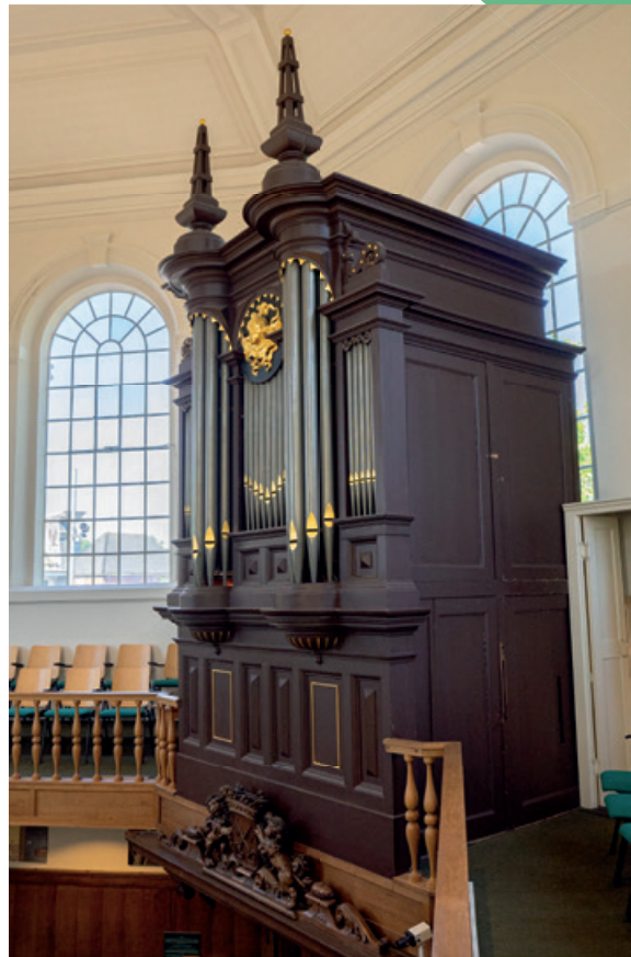
Galerij met orgel