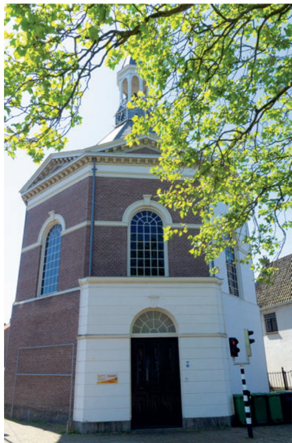
Kerkgebouw de Dorpskerk ('de Peperbus')